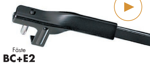
Side Pin Long