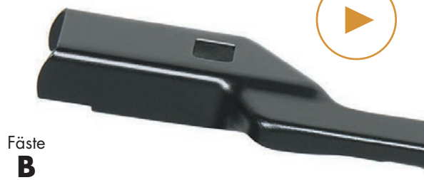
Push Button 19 mm