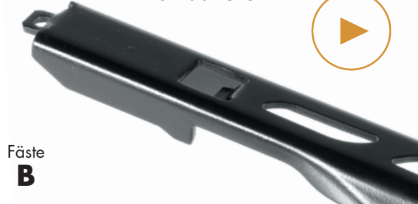
Pinch Tab Button